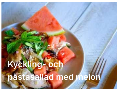
Kyckling- och pastasallad med melon