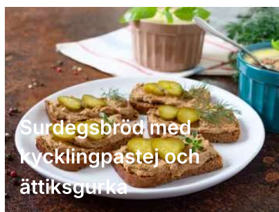
Surdegsbröd med kycklingpastej och ättiksgurka