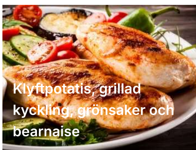
Klyftpotatis, grillad kyckling, grönsaker och bearnaise