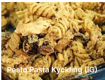
Pesto Pasta Kyckling (IG)