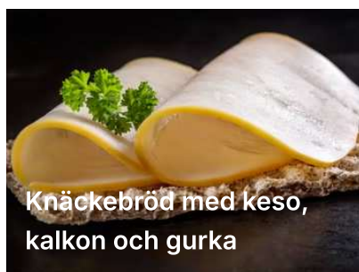
Knäckebröd med keso, kalkon och gurka