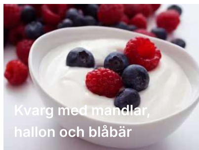
Kvarg med mandlar, hallon och blåbär

Välj en måltid från nedanstående kategorier för varje dag. Du kan välja fritt!